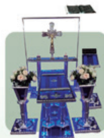
Capela de Acrílico e Alumínio com Led (Ref. 190)