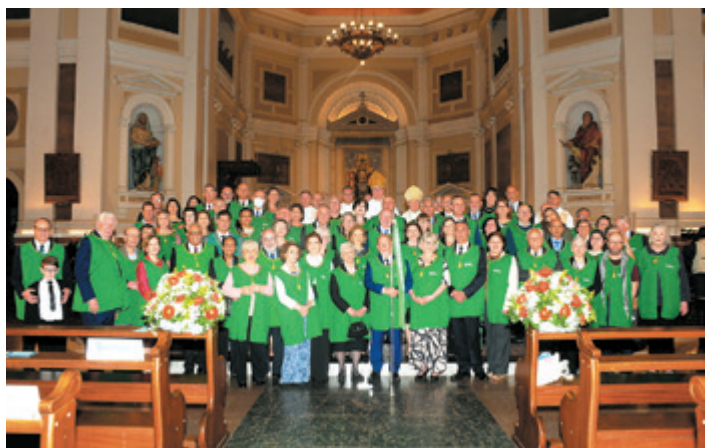
Missa reuniu membros da irmandade, fiéis e autoridades