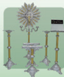
Conjunto n° 3 Luxo Dourado 6 peças (Ref. 520)