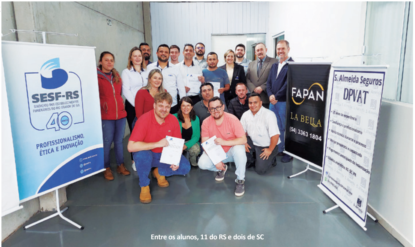
Entre os alunos, 11 do RS e dois de SC