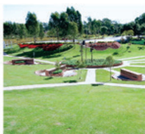
Jardim Em Memória