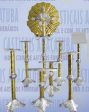
Jogo 07 Super Luxo