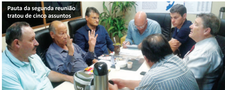
Pauta da segunda reunião tratou de cinco assuntos