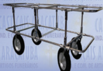
Carrinho de Cemitério