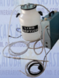
Bomba com dupla função