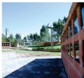
Lôculos do Jardim