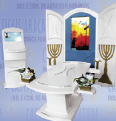
Capela Menorá com monitor