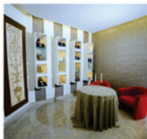
Entrega das cinzas