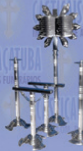
Jogo Infantil com Bíblia

Telefones: (18) 3623.5734 | 3625.2496 | 9.8154.1133 Tim (18) 9.9783.1913 | 9.9666.7078 Oscar Froes