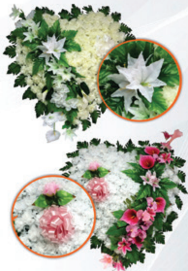
COROA CORAÇÃO GIGANTE LUXUOSA