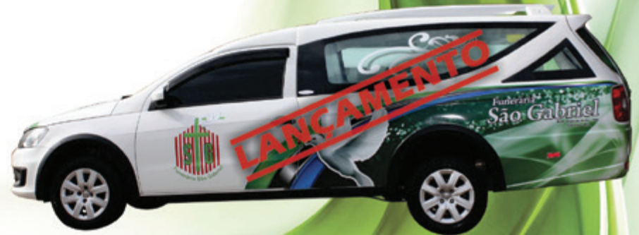
Nova Saveiro G6 VENUX