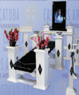
Capela Luz com monitor