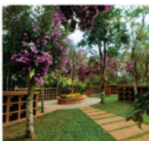
Lôculos do Bosque