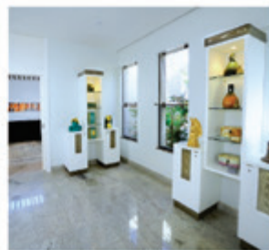
Sala das Urnas