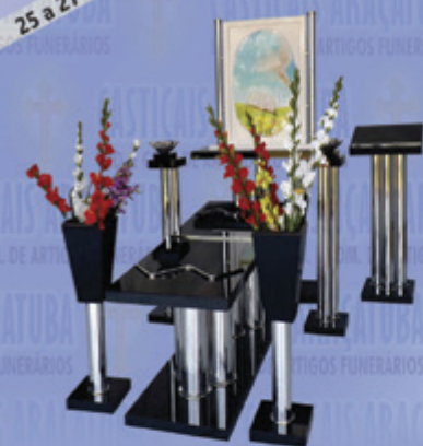
Capela Santa Fé com painel giratório

CASTICAIS ARAÇATUBA IND. E COM. DE ARTIGOS FUNERÁRIOS