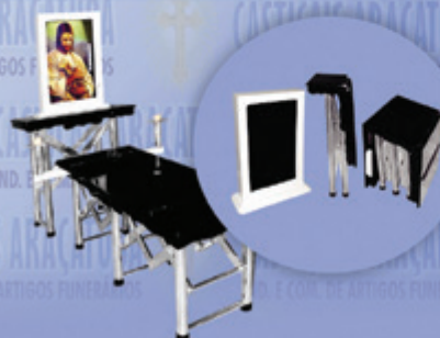
Capela Portátil com monitor