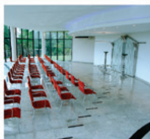
Sala de Cerimônia