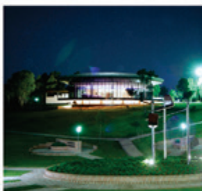
Com cerimônias noturnas