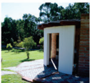
Gruta das Velas