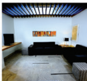
Sala de espera