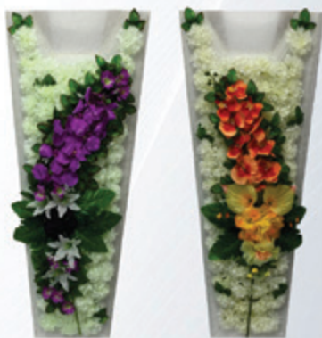
MANTO DE FLOR ARTIFICIAL LUXUOSO

Visite nossa loja virtual. www.seta.art.br