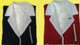
Conjunto Fem. Luxo