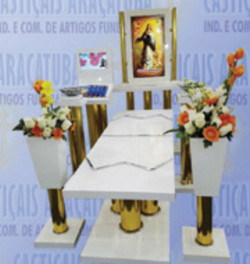
Capela Santa Fé c/ dois Monitores

Visite nosso site: www.casticaisaracatuba.com.br