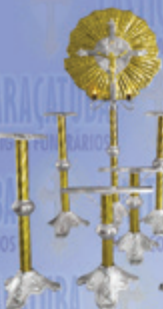
Jogo 07 Super Luxo

Visite nosso site: www.casticaisaracatuba.com.br