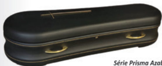
Série Prisma Azabache