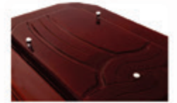
URNA OLHOS DE DEUS REF. 4010