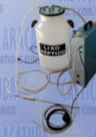
Bomba Dupla Função