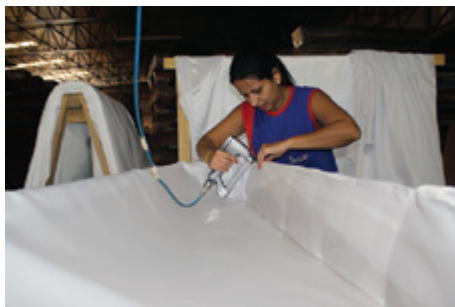
130 é o número de funcionários

A indústria ocupa uma área de 60 mil m 2 , sendo 7.600 de área construída. Ao todo, 130 funcionários produzem 420 urnas por dia, que são comercializadas em todo o Brasil, com exceção de alguns estados do Norte. “Contamos também com uma unidade fabril em Russas, no Ceará, onde produzimos 4 mil urnas por mês”, revelou Benedito. A fábrica está localizada em uma área de 3.500 m 2 e emprega 60 pessoas. O Grupo Bruschetta abocanha fatia de 8% do mercado. Para os próximos cinco anos, o objetivo é chegar a 10%, segundo o dire-