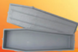
URNAS P/ REMOÇÃO

Ligue e faça o seu pedido: São Paulo: 11 2440-8004 / Recife: 81 3478-6604