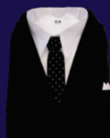
Conjunto Masculino Terno Oxford