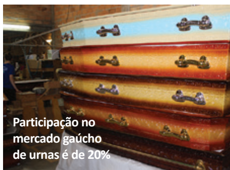
Participação no mercado gaúcho de urnas é de 20%