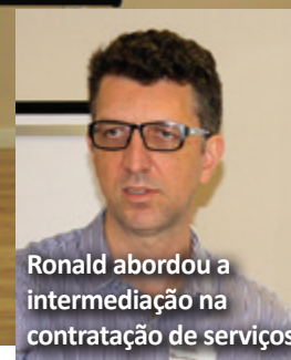
Ronald abordou a intermediação na contratação de serviços