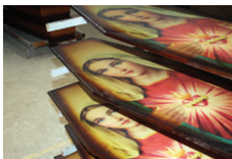
Produção é de 420 urnas por dia