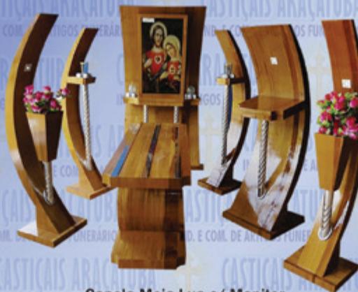
Capela Meia-Lua c/ Monitor Lançamento 2017