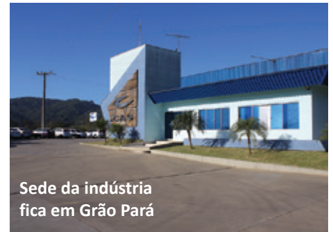
Sede da indústria fica em Grão Pará

ra atender países como Espanha, Canadá, Estados Unidos e Bolívia. Na produção de urnas, a empresa exporta para países como Angola e Uruguai. De acordo com Souza, a maior fatia de mercado da Cas no Brasil está na Região Sul, onde alcança 20% no Rio Grande do Sul, 35% em Santa Catarina e 15% no Paraná. “Estamos almejando um crescimento de 20% para os próximos três anos”, vislumbrou. Segundo o diretor, um dos projetos da empresa “é a implantação de robôs de pintura até 2021”.