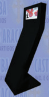
Painel Informativo c/ Monitor

(18) 3623.5734 - 3625.2496 | Rua dos Buritis, 127 - Araçatuba - 16012-170 | casticaisaracatuba@terra.com.br