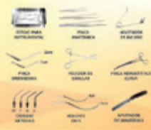
INSTRUMENTAIS DE INOX