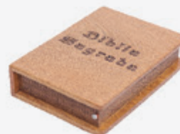
Ref: 310 Bíblia Sagrada