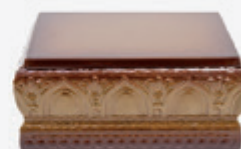
Ref: 100 Cor 06