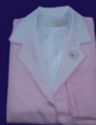
Conjunto Feminino Luxo