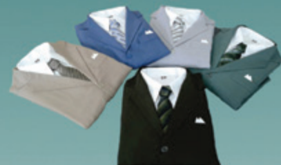
Ternos Masculinos Oxford