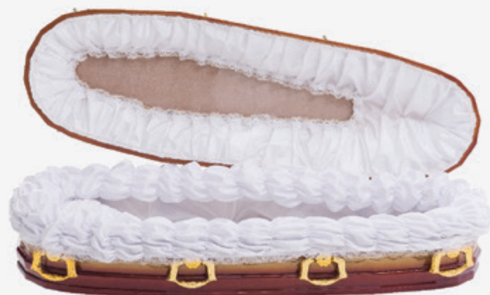
Ref: 45 Dourada Forração Especial