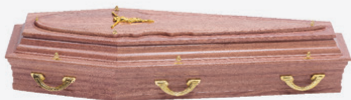
Ref: 19 Jequitibá