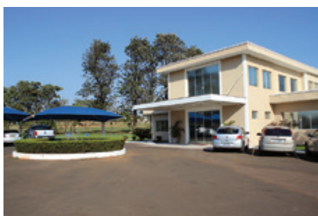
Fábrica ocupa área construída de 7.600 m 2