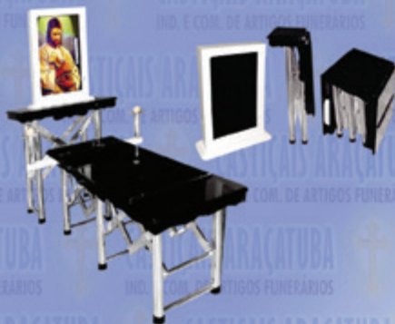
Capela Portátil c/ Monitor