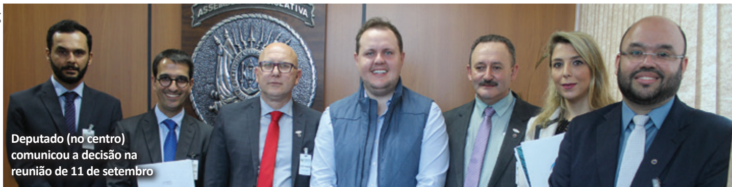
Deputado (no centro) comunicou a decisão na reunião de 11 de setembro