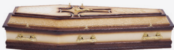
Ref: 06 Cruz Cor 01