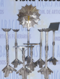
Jogo 011 Luxo