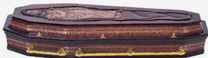
Ref: 21X Cristo Cor 08