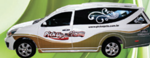
Nova Montana VENUX