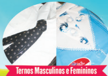
Ternos Masculinos e Femininos