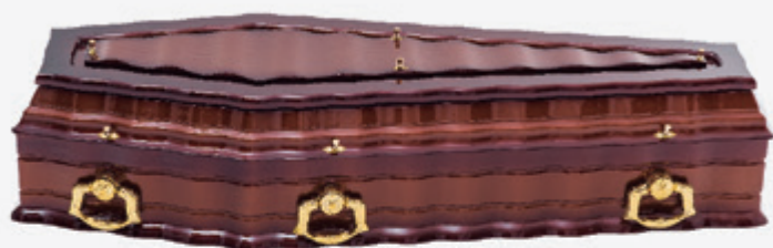
Ref: 65 Cor 13