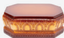
Ref: 200 Cor 03 Envelhecida