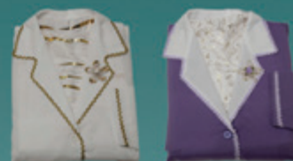
Conjunto Feminino Luxo