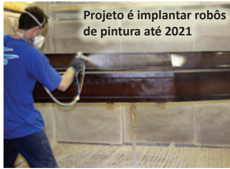
Projeto é implantar robôs de pintura até 2021