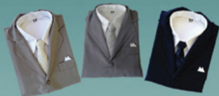
Ternos Masculinos Casimira