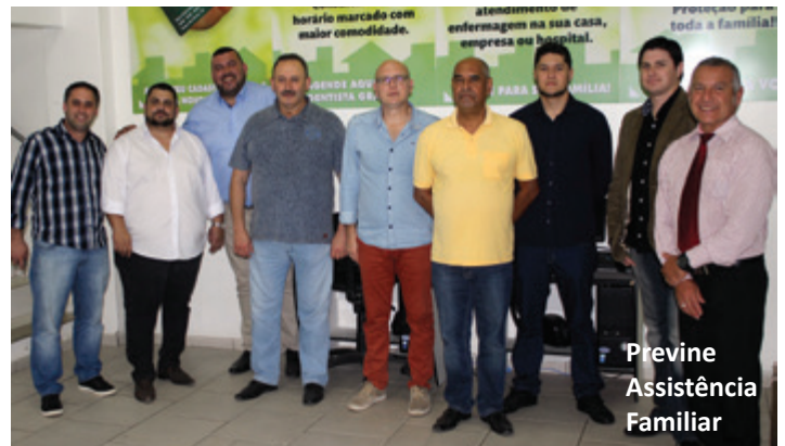
Previne Assistência Familiar