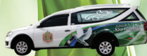
Nova Saveiro G6 VENUX